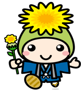
桶川市マスコットキャラクター 『オケちゃん』