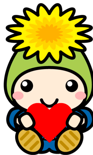
『桶川市マスコットキャラクターオケちゃん』