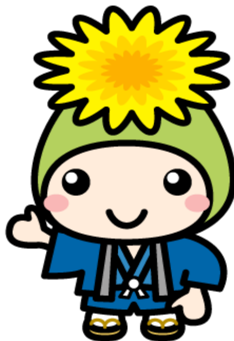
『桶川市マスコットキャラクター オケちゃん』