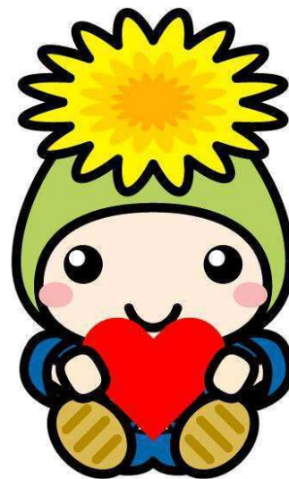
『桶川市マスコットキャラクターオケちゃん』