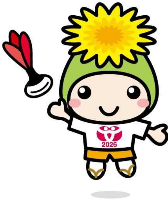
桶川市マスコットキャラクター 「オケちゃん」