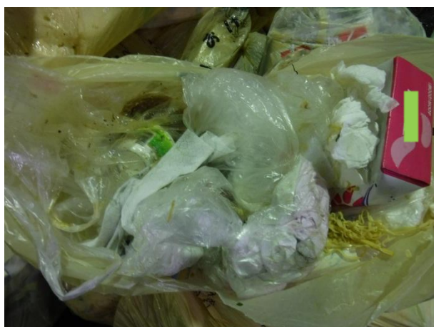
紙製容器（ティッシュの箱）が混入