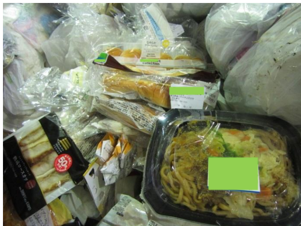
弁当がプラスチック製容器に入ったまま混入