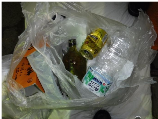
燃やせるごみにビン、缶、ペットボトルが混入