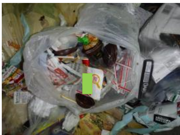
プラスチックごみが混入