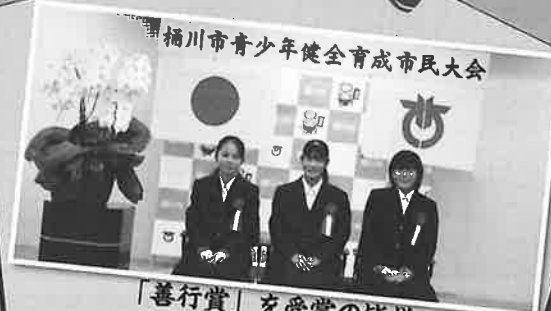
桶川市青少年健全育成市民大会 「善行賞」を受賞の皆様 ～11月21日 市民大会より～