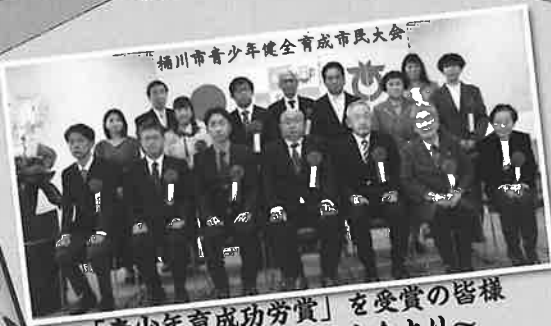
桶川市青少年健全育成市民大会 「青少年育成功労賞」を受賞の皆様 ～11月21日 市民大会より～