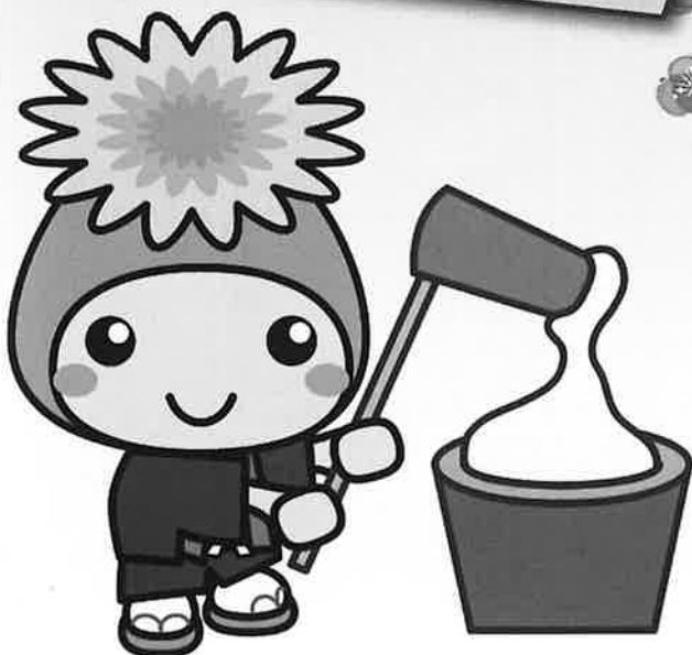
桶川市マスコットキャラクター「オケちゃん」