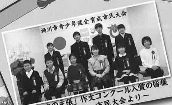
桶川市青少年健全育成市民大会 「私たちの主張」作文コンクール入賞の皆様 ～11月21日 市民大会より～