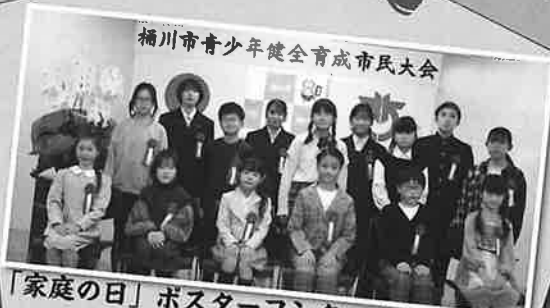
桶川市青少年健全育成市民大会 「家庭の日」ポスターコンクール入賞の皆様 ～11月21日 市民大会より～