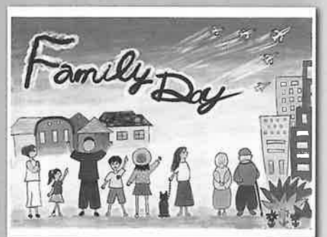
桶川中学校 3年 西山 純恋 「Family Day」