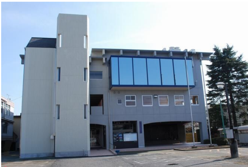
東公民館（総合福祉センター2階・3階）