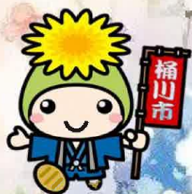
桶川市マスコットキャラクター オケちゃん