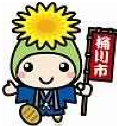
桶川市マスコットキャラクター「オケちゃん」