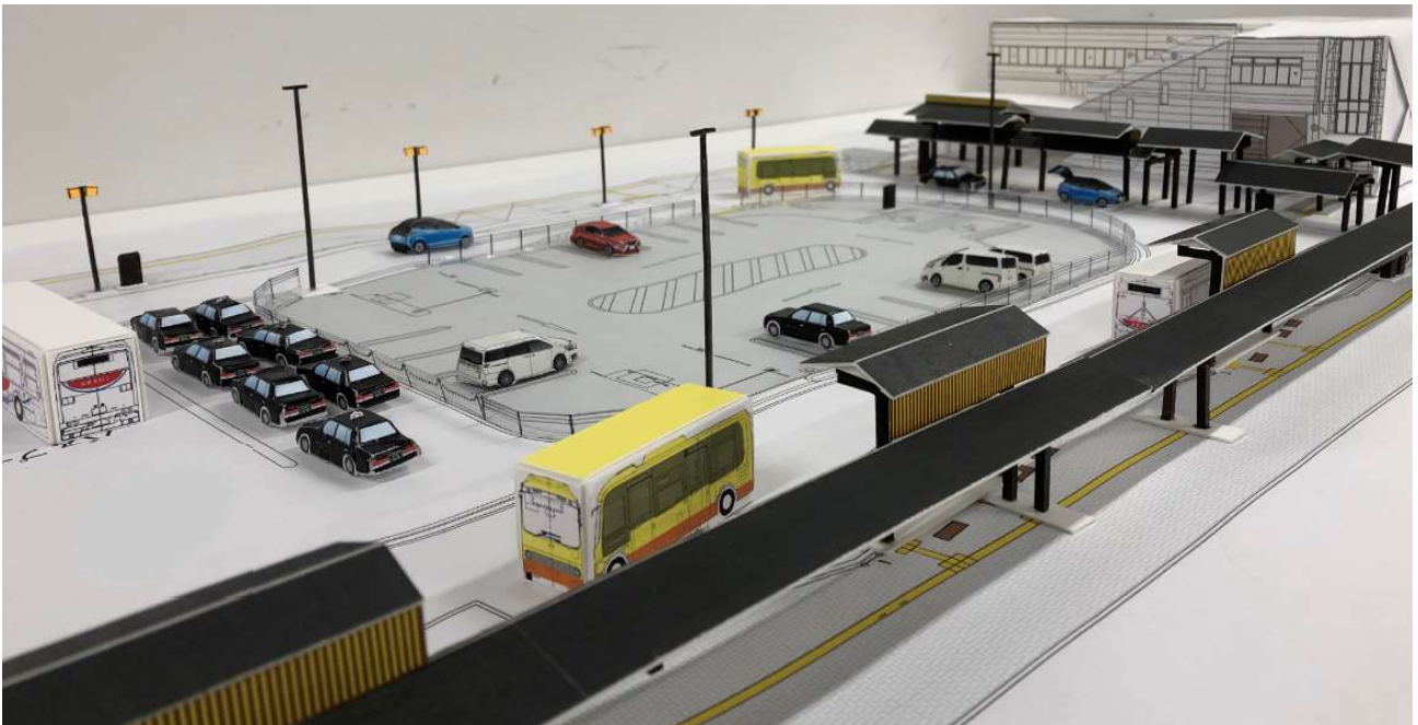
『南小跡地から駅前広場を臨む（1/100 ジオラマ）』

今後も引き続き、関係権利者様の御理解、御協力をいただきながら、事業進捗に取り組んでまいります。よろしくお願いいたします。