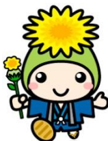
桶川市マスコットキャラクター オケちゃん

「ことぶき広場」の 東側ブロック塀 及び 西側の門扉（2か所） につきましては、老朽化していたため、撤去しました。