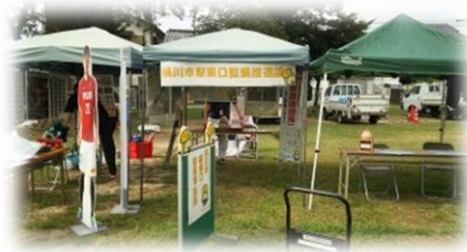
《H29. 8. 26, 27 桶川フェスティバル》

12月： 東口にも イルミネーション が点灯しました。桶川東中学校（芸術部）、加納中学校（美術部）の絵が展示されています。