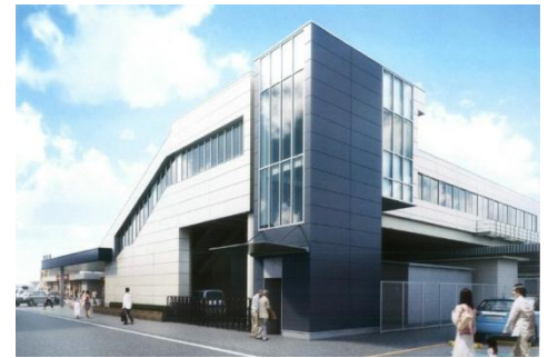
《エレベーター外装イメージ図》

今後もJR及び関係機関と綿密な協議を行いながら、エレベーターの早期設置を目指し、取り組んでまいります。