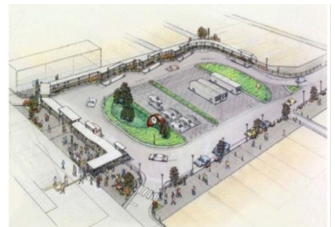
《駅前広場整備イメージ図》

昨年12月末時点で、約66%の用地取得率となりましたが、引き続き、早期整備を目指し用地の取得に努めてまいります。