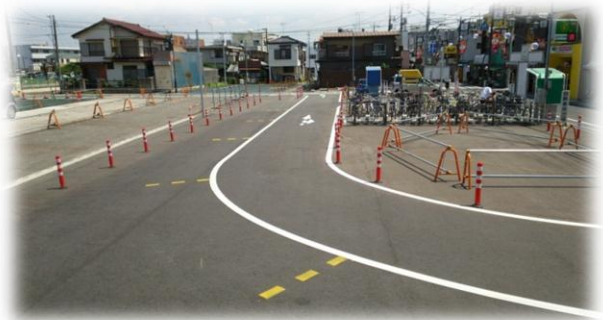
仮設桶川駅東口自動車送迎場

平成29年度も、さらなる事業の推進に向け、引き続き関係する権利者の皆さまに対するご相談を進めていきます。