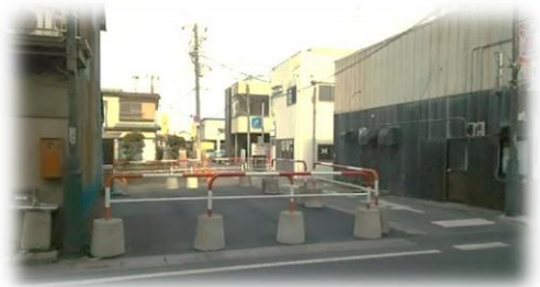
駅通りの用地の一部を譲渡していただきました。

対象となる物件数が多く、時期を調整しながら調査を進めておりますので、現時点で調査が未実施の物件等につきましても、順次ご相談をさせていただく予定です。