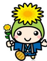
桶川市マスコットキャラクター オケちゃん