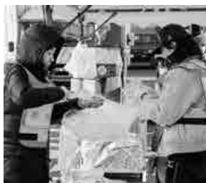
詳しくは☎安心安全課

平成31年度臨時保育士・職員登録者を募集します 市内の公立保育所の臨時職員の登録者を募集しています。 履歴書(写真貼付)、資格証明書を持参し直接保育課へ申し込んでください。 登録有効期間▼2年間 対象▼保育士資格所有者