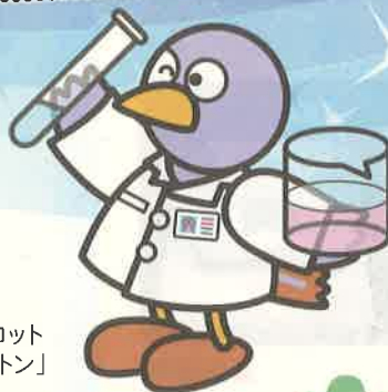
埼玉県マスコット 「コバトン」