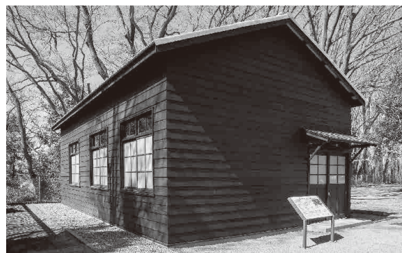
桶川飛行学校平和祈念館 守衛棟

※同日現在で入金が確認でき、氏名（団体名）公表可の場合のみ掲載しています。 また、同じ方から複数回、寄付をいただく事もあるため、件数と人数が一致しない場合があります。