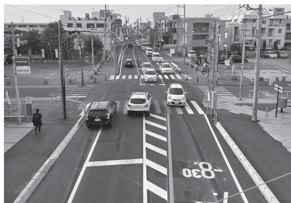
◀ 事業の進捗状況(桶川駅前交差点の様子)