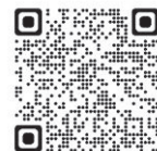
▲日本年金機構 海外任意加入説明ページ