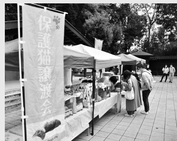
※写真は過去の譲渡会の様子