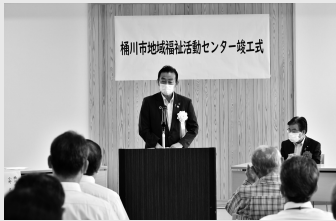
桶川市地域福祉活動センター竣工式