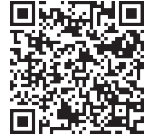
第45回桶川市民まつり