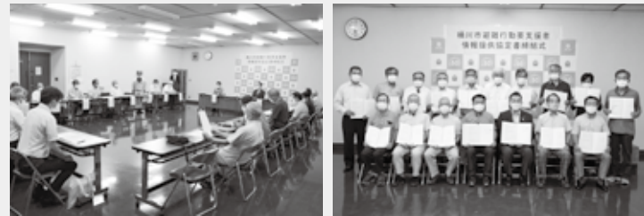
※「避難行動要支援者登録制度」とは・・・災害時に、より円滑な情報伝達や迅速な避難支援を行うため、災害時に自ら避難することが困難な人で、手助けが必要な人(避難行動要支援者)の情報を掲載した名簿を避難支援する人に提供する制度。

去る9月19日(土)、川田谷地区区長会と「桶川市避難行動要支援者情報提供協定書」の締結を行いました。 高齢・核家族化が進む中で、地震や台風等の災害が発生した際に、支援が必要な高齢者や障害者の方々(要支援者)に対する支援体制を整えておくことはとても大切なことです。このため、市では災害時に要支援者を支援して下さる自治会、自主防災組織、民生委員、警察、消防署等へ要支援者の情報を提供することができる「避難行動要支援者登録制度」*を今年の3月から実施し、地域のつながりによる助け合いの仕組みづくりを進めています。