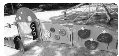
▲たっちカウンターとくるくる・びよこびよこパネル