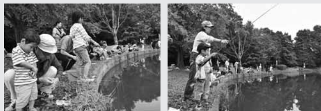
しっかりエサをつけて よ〜し、たくさんつるぞー