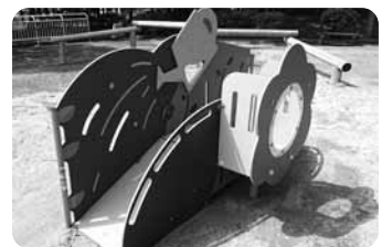
▲おはなのスロープ

今後も「オケちゃん 子ども・子育て応援基 金」にご理解、ご協 力をお願いいたします。 また、ご寄附いただき ました皆様に心より感 謝いたします。