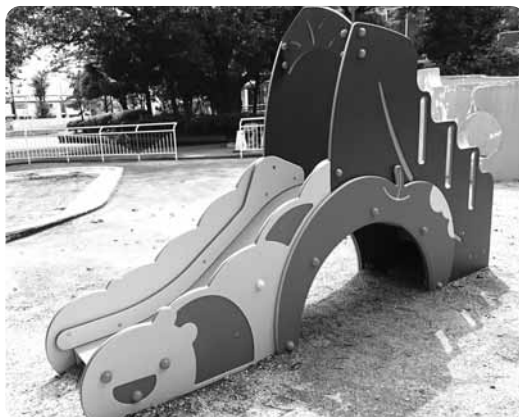
▲いもむしすべり台