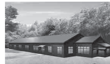
復原整備予定の兵舎棟外観パース