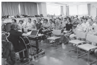
介護予防教室の様子