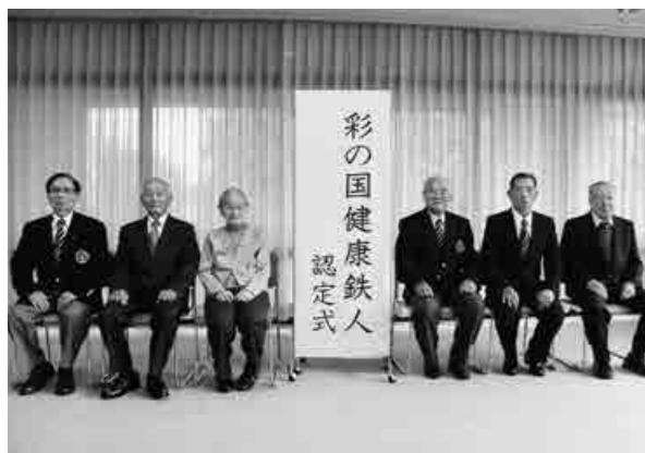
認定式（知事公館：11月6日）