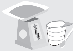
【桶川市くらしの会】

参考資料：『こんなに使える酒粕のレシピ』栗山真由美 社団法人家の光協会 2012年1月10日発行