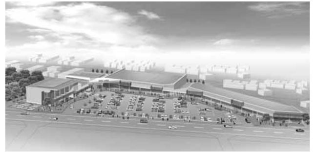
(注)事業提案時のイメージです。確定ではありません。