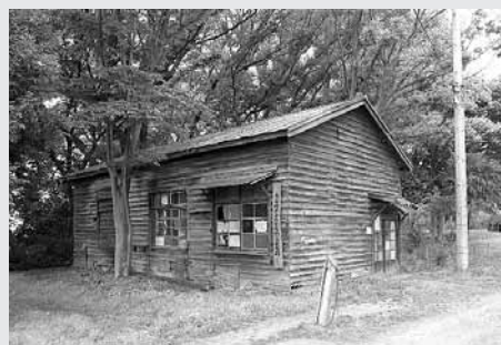
守衛棟解体調査前の現況外観