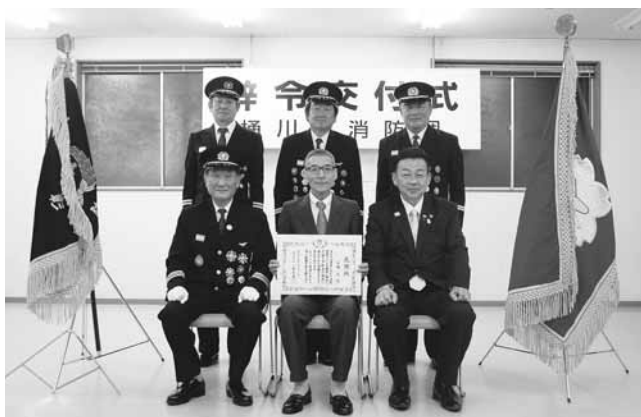
退団された皆さん