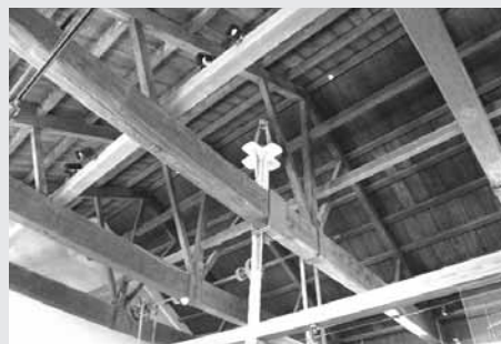
旧集成館機械工場国内最古のトラス