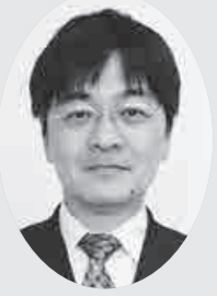
桶川市 副市長 松本 幸司