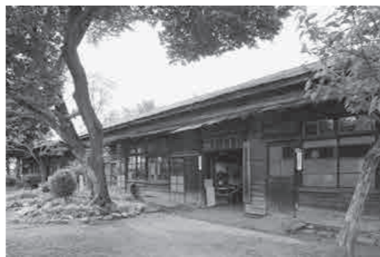
旧熊谷陸軍飛行学校桶川分教場 兵舎棟