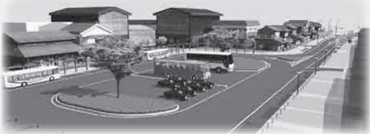
(駅前広場の整備例)

これら駅東口の事業に関する情報については、桶川市のホームページにも掲載しています。今後とも、機会をとらえて市民の皆さんへの情報提供に努めてまいります。