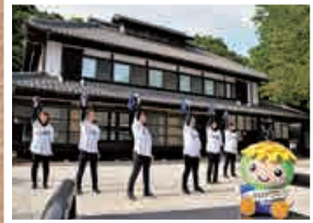
西武ライオンズ球場の大型ビジョンで流れるかもしれないダンス動画を撮影したへに♪