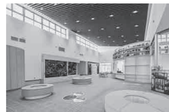
▲坂田コミュニティセンター