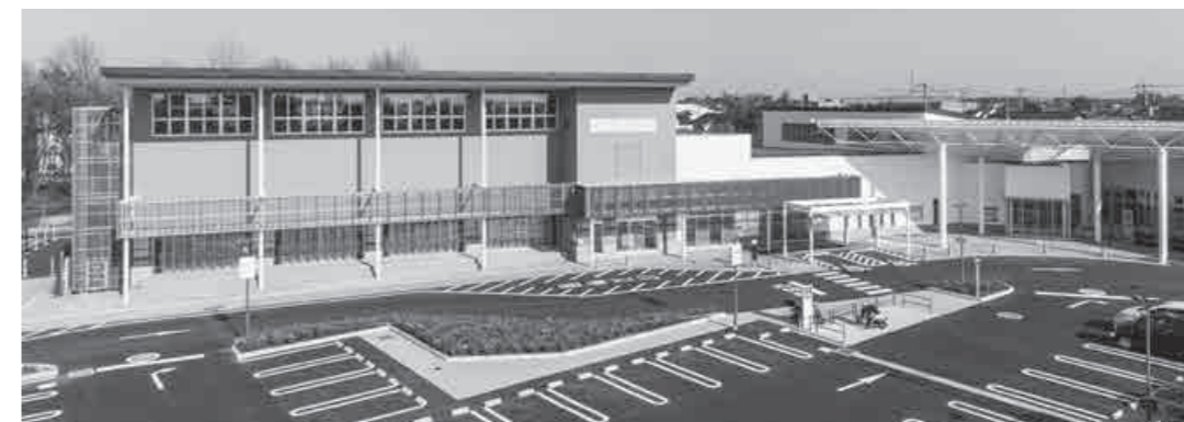
▲4月16日にオープンしたスマイルピアザ坂田