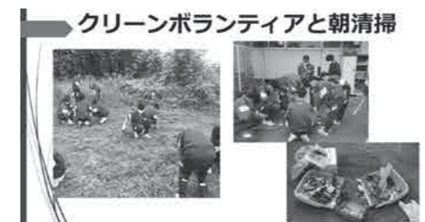
クリーンボランティアと朝清掃