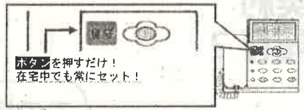
ボタンを押すだけ！ 在宅中でも常にセット！