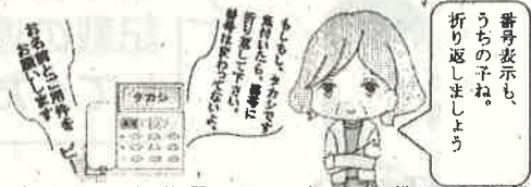
終わりまでしっかり聞いて、相手の様子を確認！