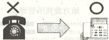
留守番電話機能付き電話機に交換！