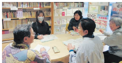
(※1) 男女共同参画情報紙「かがやき」は、男女共同参画社会実現のための啓発として、市民の公募によって選出された編集委員とともに作成しています。