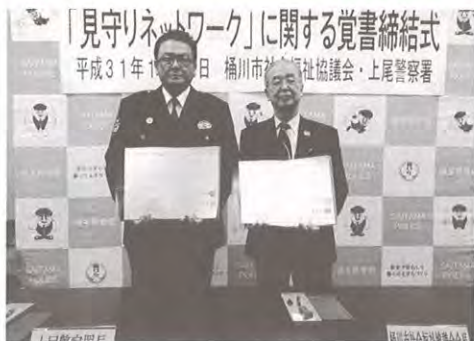
（上尾警察署安達署長様と岩崎会長）

平成31年1月22日（火）上尾警察署において、子供や高齢者等が安全に安心して生活できる社会づくりに向けた『見守りネットワーク』に関する覚書を締結いたしました。