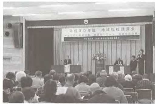
第3部 地区社協 活動発表の様子

平成31年1月31日(木) 「おけがわに広がり 地域のつながり 地区社協の輪」をテーマに東公民館で地域福祉講演会を開催しました。この講演会は、市民の方に、地区社協活動を中心とした地域での支えあい活動の大切さ・重要さを伝えるとともに、新たな地区社協づくりに対する地域住民の気運を盛り上げていくために、市社協と桶川市が共催で開催し、約120人の方々に来場いただきました。