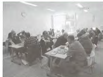
△老人福祉センターの様子