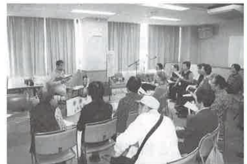
右：ステージ発表の様子