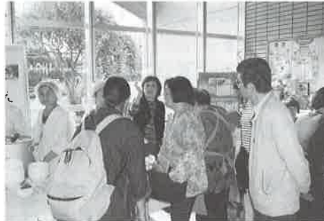
左：見本市1階ロビーの様子

この見本市は、今回で8回目の開催となりましたが、市社協登録のボランティア・市民活動団体参加の開催から回数を重ねるごとに、市観光協会、市内4中学校、ジュニアリーダーズクラブなど参加協力団体が徐々に増え、今では世代間交流の場としても大いに活気付いています。さらに、今年はシルバー人材センターに後援及び参加をいただき、様々な活動をお互いに理解しあう場として幅がまた広がり、大変実りある有意義な場となりました。