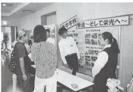
(活動を説明する桶川東中の生徒)

現在、桶川市ボランティア・市民活動ネットワークには、ボランティアグループ50団体、福祉団体10団体、地区社協9地区の合計69団体・地区が加盟しています。