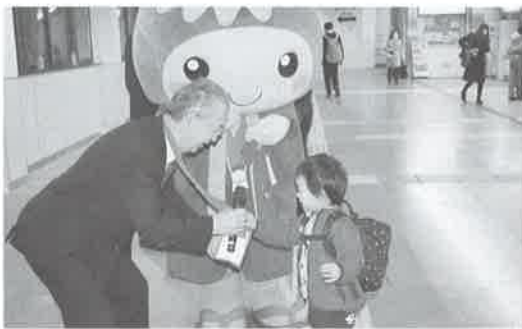
【桶川駅でオケちゃんとお街頭募金の様子】

公助が最も適切に調和さ れるよう留意しながら、 家族相互や住民相互によ る助けあいの仕組みを通 じて、住民が自立した生 活を営むことのできるよ う、様々な福祉課題や自 然災害時の対応に取組ん でまいります。