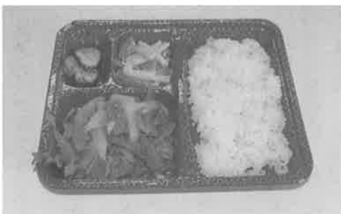
焼肉弁当62食を提供しました。