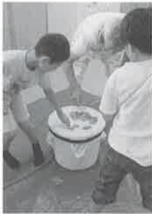
ペーゴマ勝負！ 昔遊びの1コマ

縁日では、かき氷・ポップコーン・輪投げ・ヨーヨーを行いました。当日は老人福祉センターも児童館も、いつもより多くの利用者にご来場いただき、縁日も大変盛況でした。 来場者からは、「かき氷がおいしい」「輪投げが思っていたより難しい」などの声が聞かれました。