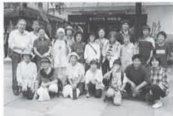
みんなでにっこり記念撮影！ 川越お買い物ツアーの様子

また、7月25日(木)には、縁日の他に川越の菓子屋横丁でのお買い物ツアー、その他、7月30日(火)には、お手玉やペーゴマ、あやとりなどの昔遊び会も実施しました。