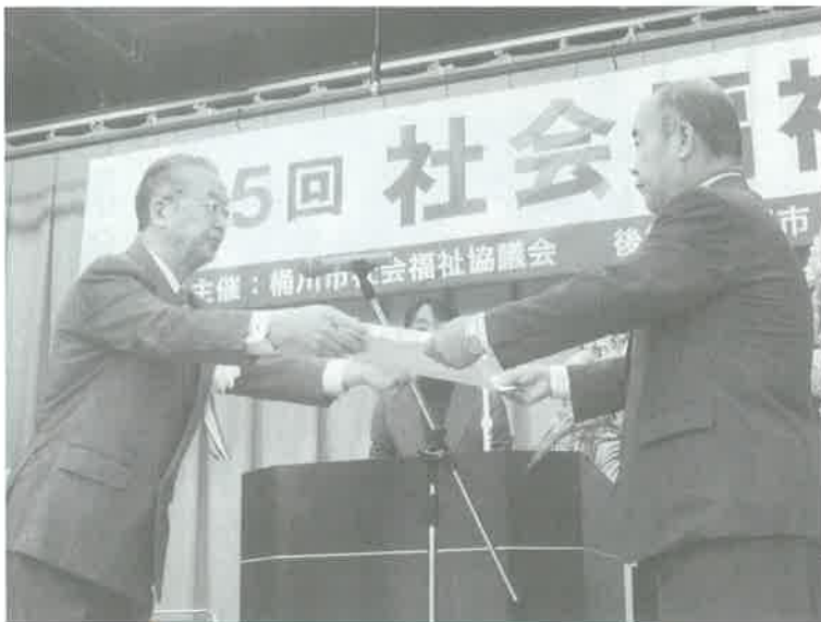
岩崎会長より表彰状の授与