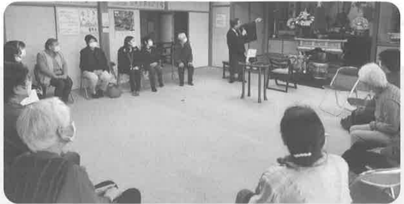
【蓮正寺サロンの様子】 住職さんのご厚意により場所をお借りして開催しています

まずは、蓮正寺サロンやイベントの開催などをきっかけとして「顔の見える関係づくり」から取り組む「上日出谷ささえ愛隊」に、ご理解とご協力をお願いします。