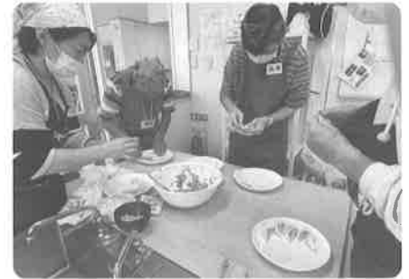
餃子づくりに初挑戦!

センターの「みんなの調理室」を利用して、親睦を深め「楽しい、うれしい、おいしい」を実感でき、新たな繋がりづくりのための「男の料理教室」を初めて開催しました。