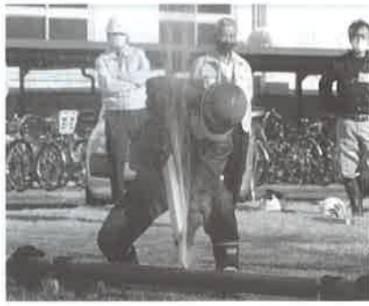
②漏水箇所には木材を差込む