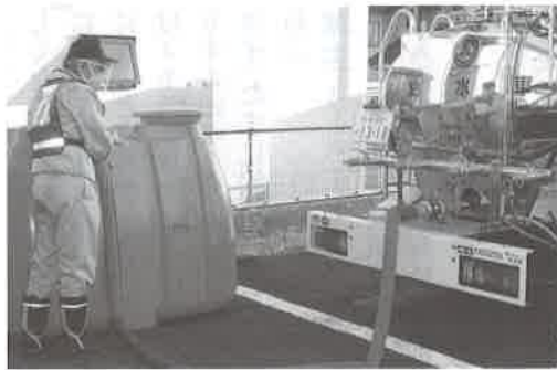
応急給水訓練風景

また、11月8、10、11、15日に水道企業団の全職員を対象に応急給水訓練を実施しました。この訓練は、災害時における初動体制の確立と迅速な応急給水活動の実施を目的として、毎年おこなっています。