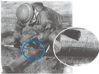
④木材を切取り養生して作業完了

水道管が急速に普及していった時期の経験豊富な職員が退職し、技術の継承は水道事業の課題の一つとなっていますが、今後も近隣事業者等