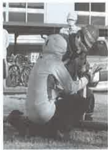
③ハンマーで打ち込みしっかり止水