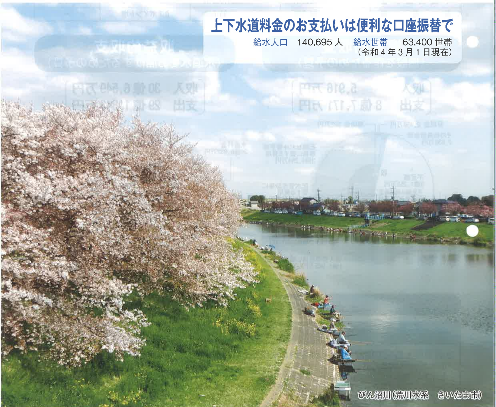
びん沼川(荒川水系 さいたま市)

給水人口 140,695人 給水世帯 63,400世帯 (令和4年3月1日現在)