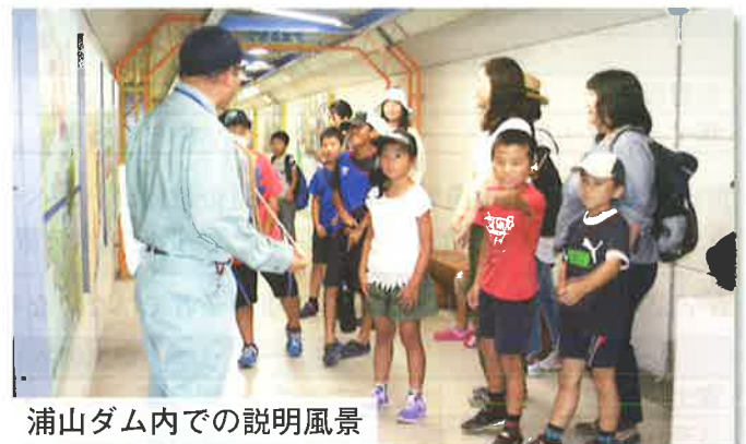
浦山ダム内での説明風景