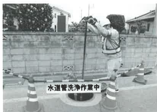
水道管洗浄作業中

なお、排水作業に先立ち、該当する地域には、作業内容のお知らせを配布します。できるだけお願いします。