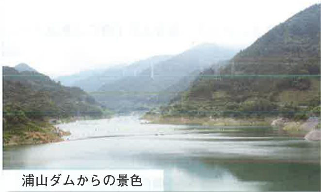
浦山ダムからの景色

今年も小学生を対象とした親子水道教室を次のとおり開催します。 夏休みの一日、親子で水道水の水源であるダムを見学し、また水にふれあいながら、限りある資源の『水』に対して関心を深め、その貴重さや大切さを楽しんで学んでいただくことを目的としたものです。 みなさん、ふるってご応募ください。