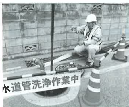
水道管洗浄作業中