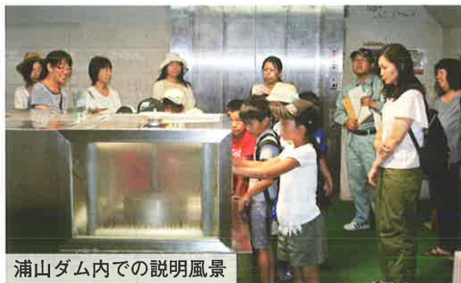
浦山ダム内での説明風景

〒364-0013 北本市中丸6丁目83番地 桶川北本水道企業団 総務課 企画財政係 ☎048(591)2775(代)