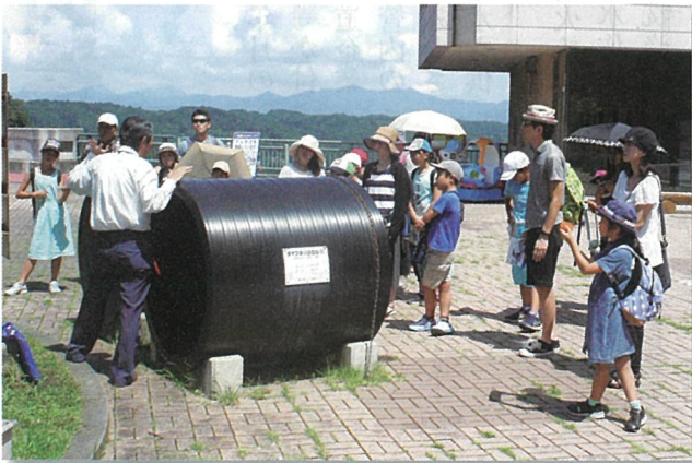
浦山ダム上での説明風景