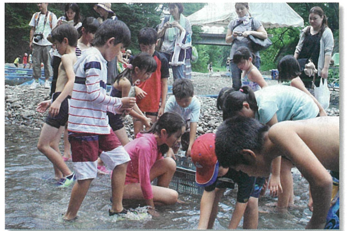
マスのつかみ取り風景