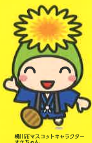
桶川市マスコットキャラクター オケちゃん

桶川市は、昭和45年11月3日に、「桶川町」から、埼玉県下31番目の市として誕生し、今年度で市制施行52周年を迎えます。桶川市マスコットキャラクター「オケちゃん」は平成22年11月3日に誕生し、市民登録されています。