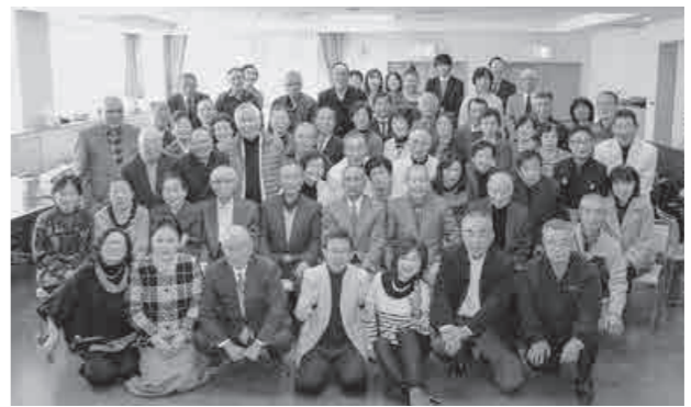
▲文化を語る会での集合写真。参加した皆さんの楽しそうな様子が印象的でした。

さらに、1月の「文化を語る会」や、所属団体による老人ホーム、地域の集まりや幼稚園などへの出張演奏を行っています。また、中学校の文化祭や小学校にお邪魔して、体験講座なども行っています。