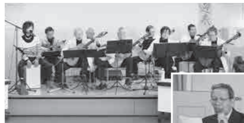
▲ハーモニカギター同好会

最後に少し宣伝をさせていただきます。3月6日に桶川市民吹奏楽団、4月9日に桶川三曲協会、5月15日に桶川市民謡連盟がそれぞれ市民ホールで発表会を行いますので、ぜひお越しください。