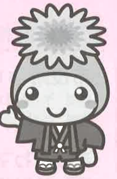
桶川市マスコットキャラクター「オケちゃん」