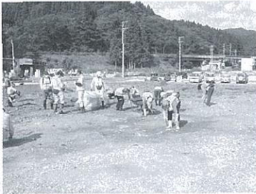
▶ みんなで瓦礫拾いした場所が…。

ボランティアバスという形で始まった災害救援の輪が、大船渡市で、少しずつ広がりを見せています。また、第2期で瓦礫拾いを行った場所では、『復興食堂』の建設も進んでいます。今後とも、ご支援とご協力をお願いいたします。