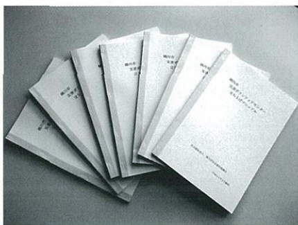
上は災害ボランティアセンター立ち上げマニュアル

このマニュアルは、桶川市で災害が起こった場合を想定して策定されており、より地域性に特化したものとなっております。また、ボランティアガイドや各種様式集も合わせて作成されており、緊急時には直ちに使用できる内容となっております。