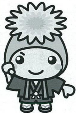
桶川市マスコットキャラクター「オケちゃん」

11月22日(木)～11月24日(土)に予定されております『第2期復興支援ボランティアバス』につきましては、多くの方から参加申込みをいただき、定員に達したため、受付を終了させていただきました。大勢の皆様方からお申込をいただき、誠にありがとうございました。