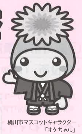
桶川市マスコットキャラクター「オケちゃん」