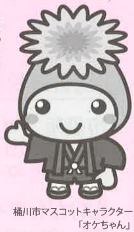
桶川市マスコットキャラクター「オケちゃん」