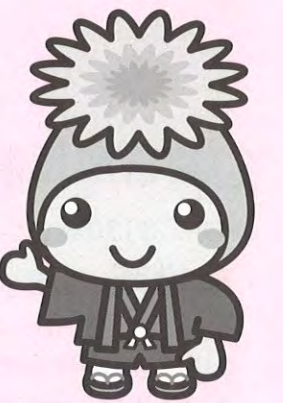
桶川市マスコットキャラクター「オケちゃん」