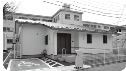
(3月10日 桶川西放課後児童クラブ分室)

西小学校敷地内に新しい放課後児童クラブ（定員40人）が完成し、内覧会が行われました。近隣住民や児童、保護者、学校関係者など多くの人々が参加しました。