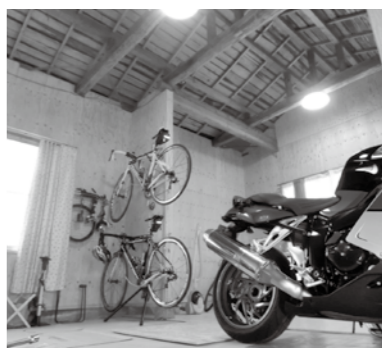
▲空き家の活用事例

空き家の活用や古民家再生事業の展開を考えています。現在、アイデアを絞り出しているところですが、空き家をリノベーションして外国人労働者向けの社員寮にしたら面白いのではないかなと思っています。