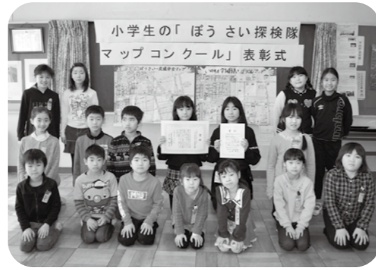
14回目を迎えた今回は、全国の小学校や子ども会などから2,582作品が寄せられました。 (2月20日 日出谷小学校)